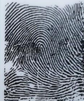
Ngón trỏ trái Left index finger